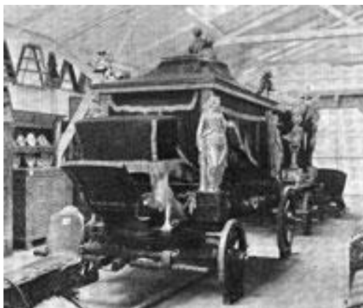
Ligvogn fotograferet i 1915 på Frilandsmuseet - måske identisk med "Fløjlsvognen"?

Nærmere Bestemmelser til Modification af de oprindelige bleve senere giorte (iflg Fac. Skr af april 1795, No 284) Pl. 5 Feb 1793 og 29. Juni 1795. En forhøielse af Taxten skete ved Pl. 12 Juni 1812 (No 633). Efterat fdr. 5 Jan 1813 havde gjort Forandring i Pengevæsenet, udgaves under 30 Jan s.A. en Raadstue-Placat, som fastsatte en ny Taxt, uden at Facultetet derom var raadspurgt; det blev oplyst, at ved dens Indførelse vilde der foranlediges et Aarligt Tab af 3437 Rbd (fra Correspondance No 633-635), hvorfor Facultetet anmodede Directionen om at udvirke en forandring, Saaledes at den gamle Taxt bibeholdtes med Overgangen til Rigsbankpenge Daler og Daler. Dette bestemtes ogsaa ved resol. 5 Mai 1813, meddeelt igiennem Univ.Directionen til Magistraten 8 Mai og communiceret ved Raadstue Plac. 17 Mai 1813: s.Bil. F.s. Ogsaa Resol. 9 Juni 1812 om Ligb. Taxten udgit giennem Univ. Direch til Magistarten, og i Overensstemmelse dermed er taxten i endnu stemmende med den, der ved Indretningens Begyndelse blev fastsatte og ved kort efter udkomende Placater nærmere bestemt. Den ved nysnævnte Resolution fastsatte og endnu gieldende Taxt findes Bil. F2.