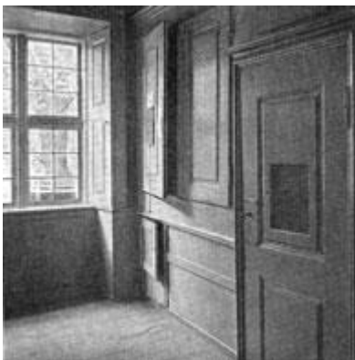
Foto 1915 af ligbærerkontoret på Regensen - vindue ud mod Regensgården. I skabene opbevaredes ligbærernes kapper.

Derefter staaer Liigbæringen og alle de derved Ansatte aldeles under det theologiske Facultet alene; det har udstedet Instruxerne som ere meddelte Vedkommende, og Formanden og Cassereren aflægge Eed til Facultetet.