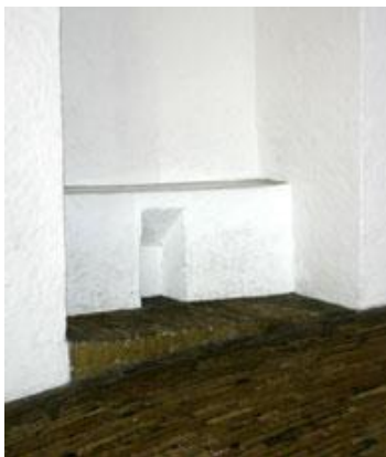
Billede tv: Øverste del af tårnet ses de tre nicher med plads til instrumenterne mahognistativernes 3. ben stod i hullet

Qvæstor gjorde dernæst opmærksom paa, at det ved Consistoriums Skrivelse af 24de f. M er bifaldet, at der ved Afleveringen maa medfølge de ældre astronomiske Instrumenter, der henstaae i de dertil indrettede og med Gitterdøre forsynede Muurnicher paa Taarnets Trappeopgang, nemlig en stor Høidecirkel, en Messingqvadrant efter engelsk Konstruktion og en do efter fransk Konstruktion, alle fastgjorte paa svære Mahognistativer, saavelsom et af Longomontani construeret Planetarium, der er indmuuret i en af Taarnets Vægge.