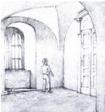
Tegning fra ca. 1840 af den murede væg med den dobbelte dør (Bymuseet)

Paa Taarnopgangen er anbragt til venstre for Indgangen et muret Skillerum, hvori en Gitterdør, herfra Indgang til den deel af Sneglegangen som fører ned under Jordfladen omtrent 2/3 af en Taarnomgang; en Port som fører ud til samme beskrevne Bibliotekslokale over Kirken, en enkelt Dør, som er for Kaminværelse, En do Dør til Closettet, en do Dør til Kirkeloftet. Et muret Skillerum tværs over Opgangen med en Doppelt Dør, som Aflukke for den øverste Deel af Taarnet. (se billedet herunder)