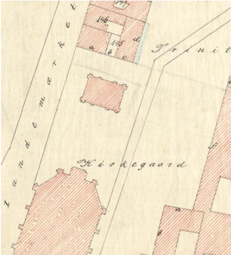
Udsnit af Situationsplan, 1870.