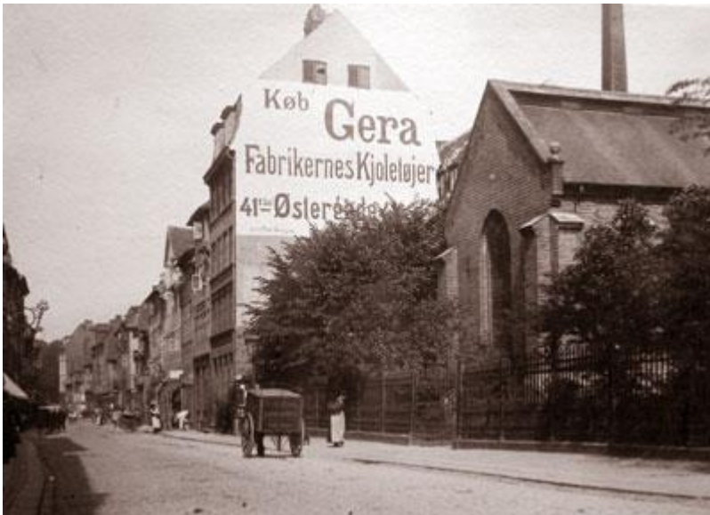
Landemærket. Foto ca. 1895 (Københavns Bymuseum)

På Københavns Bymuseum findes billeder af Landemærket set mod Kongens have, hvor man aner lighuset side ud mod gaden.