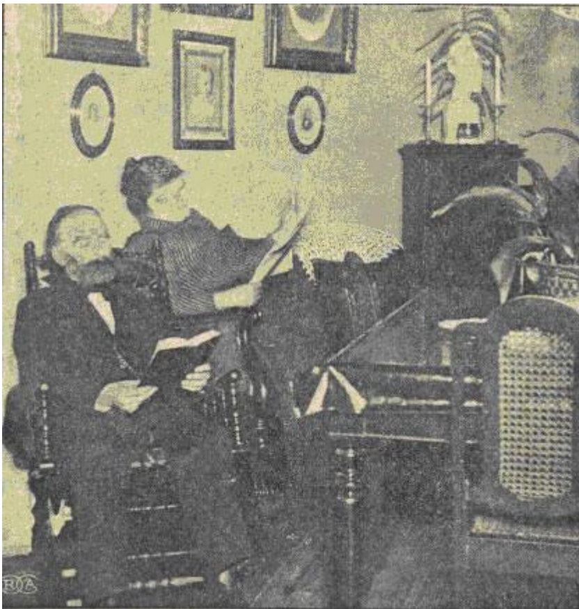
Hjemlig Hygge i Taarnets Top.

Naar man om Aftenen staar og kigger op til Toppen af Taarnet, der som en uhyre Peberbøsse tegner sig mod den lyse Himmel, da kan man se et lille, klart Lys, som titter ud af et af de allerøverste Vinduer.